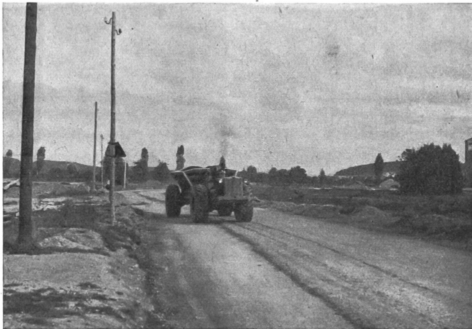
Ansicht einer Motor-Kies-Transportmaschine

Die Einzelteile des Motors sind für die ganze Typenreihe weitgehend gleich (Zylinderköpfe, Dichtungen, Ventile, Ventilführungen, Ventilsfedern, Kipphebel, Ventilstößel und