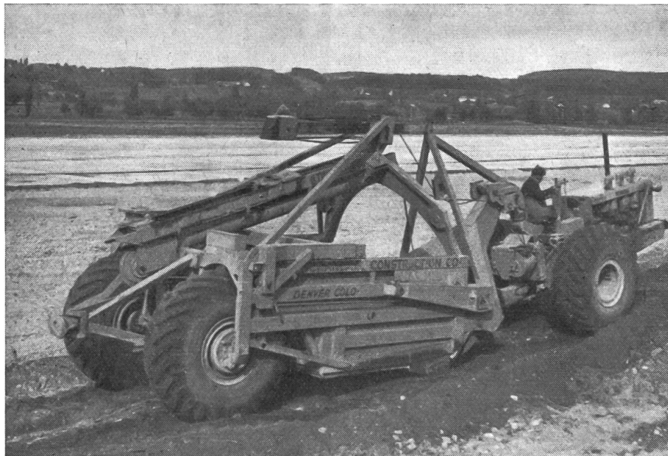
Ansicht einer Motor-Erdschaufel