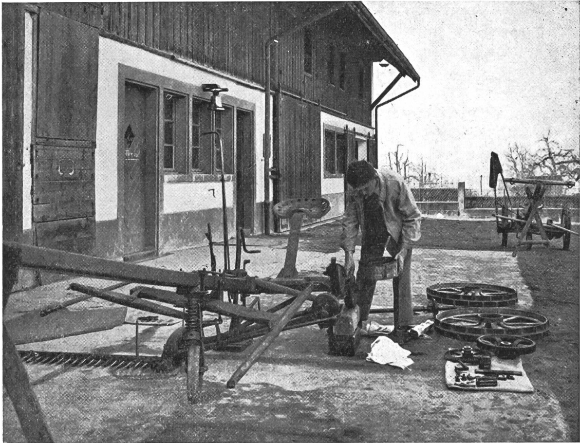
Gründliche Revision und Reinigung einer Mähmaschine