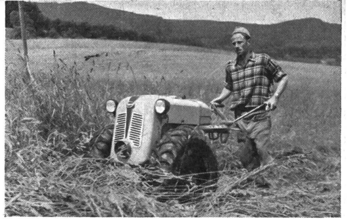
Links: Einachstraktor S-Super mit rotierender, 140 cm breiter Hackegge. Rechts: Mähen mit dem neuen Einachstraktor Rapid S-Spezial, 12 PS, mit 190 cm Mähbalken.

antrieb versehen. Für diese Maschine sind vorläufig folgende Zusatzgeräte erhältlich: Zusatzstollen zu Pneubereifung zum Mähbalken an ausgesprochenen Steilhängen, Vorgelege mit Riemenscheibe, Anhängervorrichtung, Getreideablegevorrichtung.