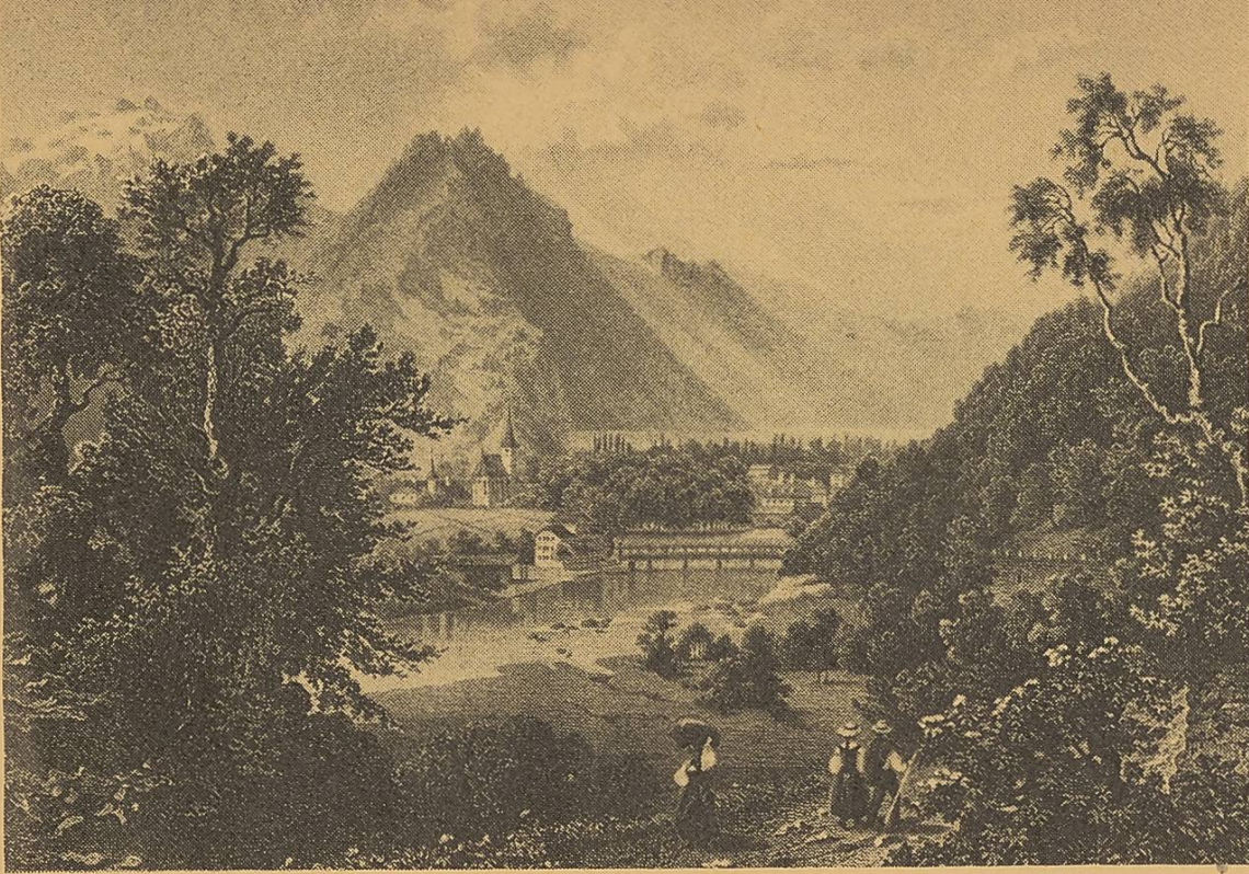
Aarelandschaft bei Interlaken nach einem alten Stich.

Paysage des bords de l'Aar d'après une ancienne illustration.