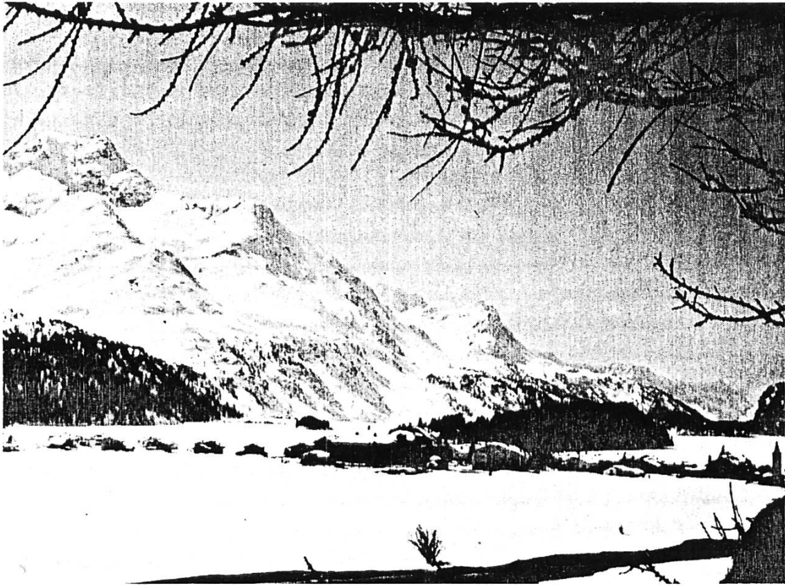
Die Silser Ebene, Blick gegen Sils-Baselgia.

Für 59 Hektaren ausgezonten Landes muss infolge des Tatbestandes der materiellen Enteignung Entschädigung bezahlt werden. Die Gesamtkosten belaufen sich auf rund 10 Millionen Franken, was einem Quadratmeterpreis von rund 17 Franken entspricht. Rund 45 Hektaren Land konnten durch eine quartierweise Landumlegung mit Konzentration der Bauten auf einzelne Weiler ohne Entschädigung geschützt werden.