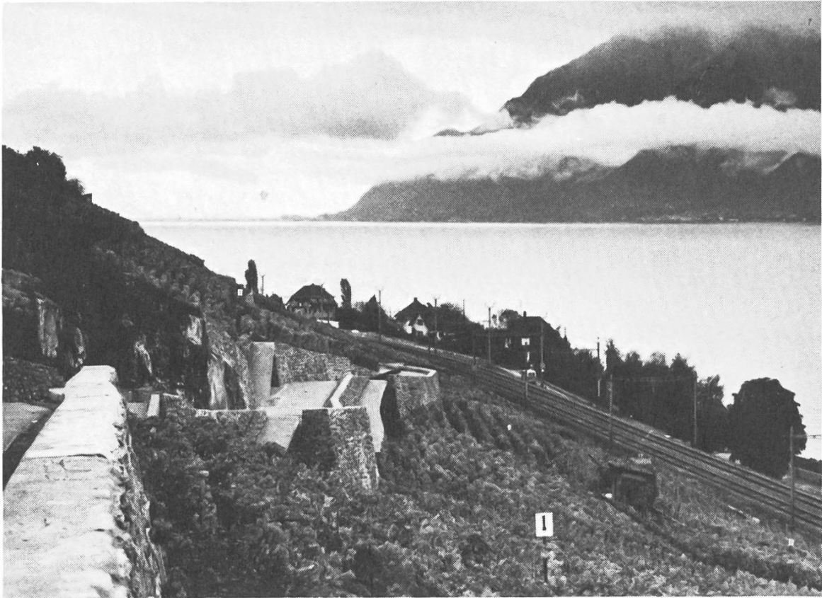
Der Landschaft gut angepasste neue Rebbergstrasse im Lavaux, La Villette (VD).

Améliorations foncières à Lavaux. La nouvelle route entre Villette et Cully, un exemple d'intégration au paysage.