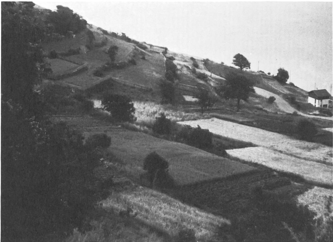
Bewirtschaftete Ackerterrassen in Erschmatt (VS).

Améliorations foncières à Lavaux. La nouvelle route entre Villette et Cully, un exemple d'intégration au paysage.