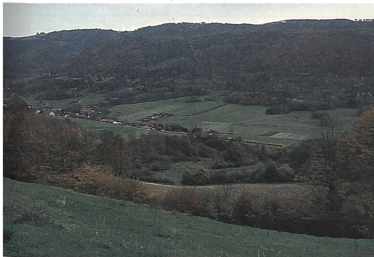
Vue d'ensemble du territoire communal de Soulce

• Val Maggia inférieur TI: Occupée à lutter contre le tourisme de masse dans le haut du Val Maggia, la FP peut démontrer dans la partie inférieure de la vallée que l'entretien du paysage contribue à la promotion d'un tourisme «doux». Le Fonds d'utilité publique du canton de Zurich soutient d'un montant de 150'000 francs un projet commun de l'APAV (Associazione per la protezione del patrimonio artistico e architettonico di Valmaggia) et de la FP. Son but est d'inventorier les plus précieuses des structures viticoles abandonnées et de les remettre en activité. Les "vignetti" sont les témoins de la paysannerie d'autrefois - un petit monde en soi. Leurs divers éléments: terrasses en pierres de taille et murs pourvues de niches à ruches, "carasc" (piliers), pergolas en châtaignier, systèmes d'irrigation, cantines, étables et autres bâtiments, témoignent d'une forme de culture multifonctionnelle et bien adaptée aux conditions, où rien n'est laissé au hasard. Cependant, de nombreux aspects historiques,