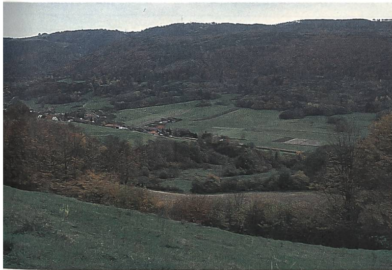
Vue d'ensemble du territoire communal de Soulce

• Val Maggia inférieur TI: Occupée à lutter contre le tourisme de masse dans le haut du Val Maggia, la FP peut démontrer dans la partie inférieure de la vallée que l'entretien du paysage contribue à la promotion d'un tourisme «doux». Le Fonds d'utilité publique du canton de Zurich soutient d'un montant de 150'000 francs un projet commun de l'APAV (Associazione per la protezione del patrimonio artistico e architettonico di Valmaggia) et de la FP. Son but est d'inventorier les plus précieuses des structures viticoles abandonnées et de les remettre en activité. Les "vignetti" sont les témoins de la paysannerie d'autrefois - un petit monde en soi. Leurs divers éléments: terrasses en pierres de taille et murs pourvues de niches à ruches, "carasc" (piliers), pergolas en châtaignier, systèmes d'irrigation, cantines, étables et autres bâtiments, témoignent d'une forme de culture multifonctionnelle et bien adaptée aux conditions, où rien n'est laissé au hasard. Cependant, de nombreux aspects historiques,