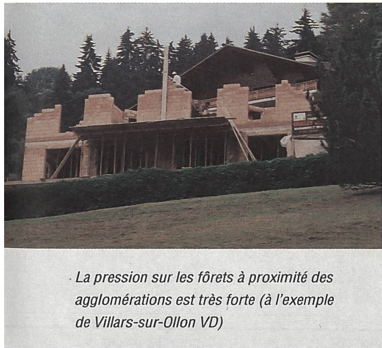
La pression sur les forêts à proximité des agglomérations est très forte (à l'exemple de Villars-sur-Ollon VD)

défrichement importants (dès 5000 m 2 de surface), après que le consentement obligatoire de l'office fédéral avait déjà été supprimé dans le projet du Conseil fédéral. La FP s'est engagée pour demander aux membres de la Chambre haute de conserver au moins ce droit d'être consulté, de telle sorte que subsiste une pratique unifiée à l'échelle de la Suisse pour les questions de déboisement. En mars 1999, le Conseil national a retouché sur ce point le texte adopté par le Conseil des Etats, si bien que le dossier est revenu en juin devant la Chambre haute pour un examen déterminant. Après d'intenses discussions, la FP a réussi à convaincre une très faible majorité du Conseil des Etats de la nécessité de conserver le droit d'être entendu.