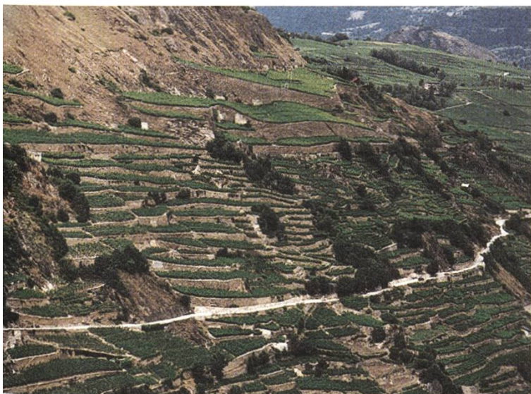
Les paysages en terrasses, comme ici près de Sion VS, sont l'objet d'études proposées par la FP dans le cadre d'un PNR

intitulé «Paysages et habitats de l'arc alpin». Le 8 janvier 2001 nous avons présenté, en anglais, deux thèmes de recherches, l'un sur les paysages de terrasses et leurs modèles d'entretien, l'autre sur l'entretien des paysages selon un système collectif institutionnalisé. En voici les titres: Alpine terraced landscapes – new models for the management and maintenance of a significant cultural heritage et Maintenance of the traditional cultivated Alpine landscape and ecological reproduction measures for the preservation of living and usable areas by means of institutional resource regimes involving voluntary work, common property regimes and other forms of collective action.