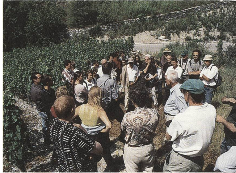
Rebbergmelioration Salgesch VS, Tagung der SL 2000

Die Rebbergmelioration Salgesch, die sich vom anfänglichen Sündenfall zu einem Modellprojekt entwickelte, wurde an der Jahrestagung vom 23./24. Juni 2000, die gleichzeitig das 30-jährige Jubiläum der SL darstellte, präsentiert und diskutiert. Auch wenn noch zahlreiche Probleme vor allem in der Pflege der Naturflächen der Melioration bestehen, so konnte doch insgesamt eine positive Bilanz gezogen werden. Insbesondere ist es gelungen, das Relief der Landschaft zu erhalten und die wichtigsten Naturoasen, die mitten in den Rebflächen liegen, zu schützen. Nicht erfüllt werden konnte bislang aber die Hoffnung auf ein gemeinsames Rebbewirtschaftungskonzept. Im zweiten Teil der Tagung wurden Beispiele von Zusammenarbeitsprozessen und grossräumigen Schutzbemühungen in Frankreich (Referent: Régis Ambroise vom Landwirtschaftsministerium in Paris) und im Wallis (Referent: Staatsrat Wilhelm Schnyder) vorgestellt. Lili Nabholz präsentierte die Sicht der SL. In einer Podiumsdiskussion unter der Leitung von Frau Bettina Mutter diskutierten Vertreter aus dem Wallis und Graubünden sowie vom Buwal die Erfahrungen mit der Welterbekandidatur, der Nationalparkerweiterung und dem Pfywaldprojekt. Eine Exkursion führte die Tagungsteilnehmer/innen am zweiten Tag in den Pfywald, dessen Schönheiten und Probleme von Philippe Werner in gewohnt eindrücklicher Manier aufgezeigt wurden.