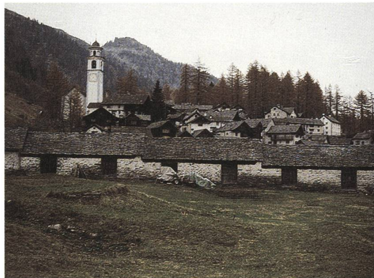
Die SL setzt sich für eine natur- und landschaftsorientierte Tourismusentwicklung in Bosco Gurin TI ein

Der Autoren kommen zum Schluss, dass sowohl der stagnierende Skitourismus in der Schweiz und im Tessin und auch die schwierige Finanzlage von Bosco Gurin gegen das Metroprojekt sprechen. Die Landschaftseingriffe und Umweltbelastungen, wie auch die Veränderungen des gut erhaltenen Ortsbildes (ISOS) wären laut ihren Aussagen bei diesem Bauvorhaben so gravierend, dass die Basis für eine natur- und landschaftsorientierte Tourismusentwicklung unwiederbringlich zerstört würde. Die Studie zeigt praxisorientierte, innovative Möglichkeiten auf, wie die vorhandenen Stärken von Bosco Gurin genutzt und Schwächen gezielt abgebaut werden können. Die Ruhe und Abgeschie-