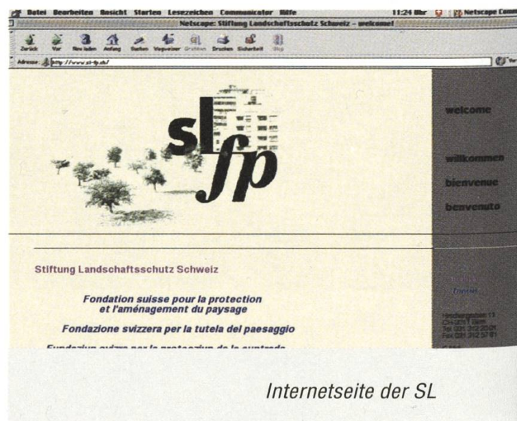
Internetseite der SL

Nach der Änderung des deutschen Namens, den neuen Abkürzungen in den anderen Sprachen und des neuen modernen Logos, ist die Internet-Hompage eine Zusammenfassung dieser Neuerungen und ein Ort der Information und der raschen Kommunikation. Dank der Links mit «paysage», «Landschaftsschutz», «paesaggio» und «landscape» wird