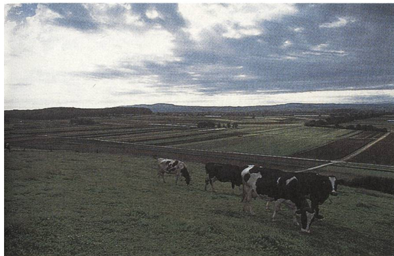
Le Seeland biennois dispose d'un grand potentiel paysager

pecter l'autre tel qu'il est, avec ses différences. Cette considération vaut tant pour la nature que pour une personne d'une autre région linguistique. Le bien-être a été défini en fonction de cette acceptation. Mais régénération et rencontre sont tributaires dans une large mesure de l'espace. Il convient donc de leur redonner la force de se reconstituer et, pour ce faire, de les libérer de modes d'exploitation dominateurs et monostructurels. L'objectif du parc de régénération consiste à créer et à mettre en valeur des espaces publics favorisant la rencontre entre les hommes, la rencontre avec la nature et la