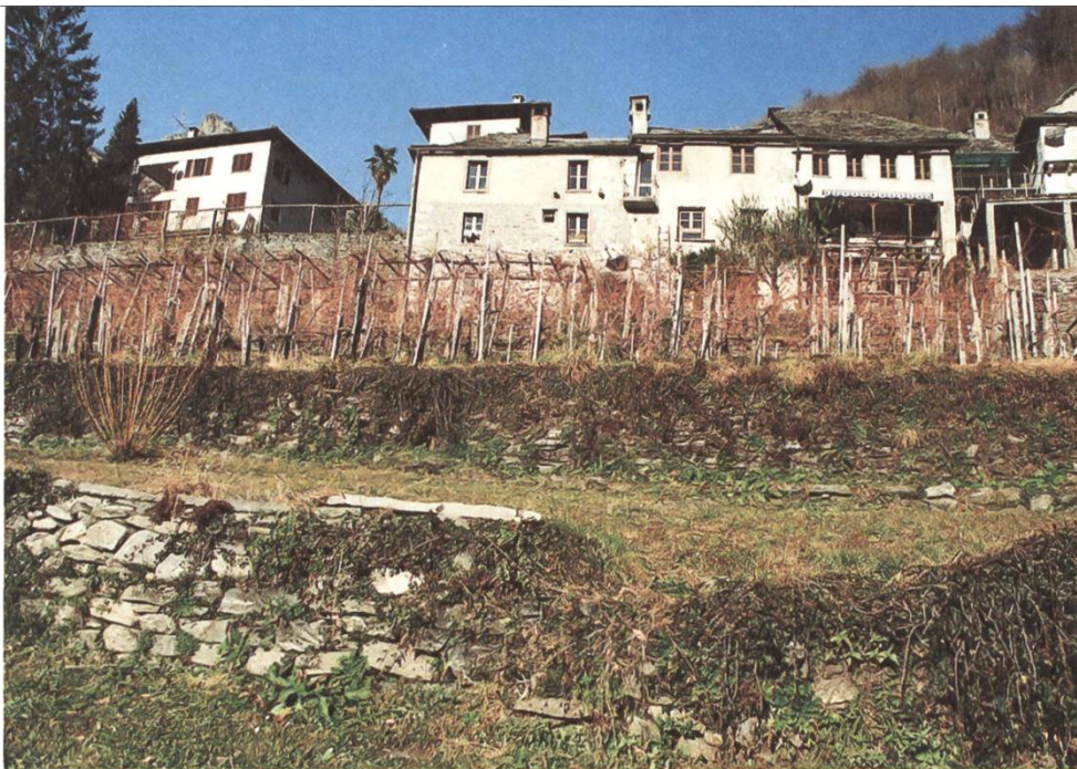
Noch bewirtschaftete Terrassen in Loco TI