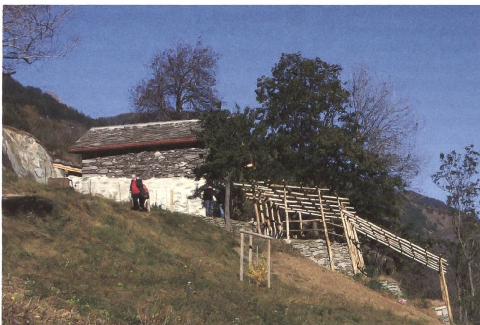
Der restaurierte Bau mit Pergola in der Kastanienselve Salzgäb/Mörel VS

Der Walliser Weinbau geht auf römische Zeiten zurück, ja möglicherweise noch Jahrhunderte weiter, wie jüngste Pollenstudien 2007 im Gebiet Montorge bei Sion festgestellt haben. Auch im Oberwallis wurde der Rebbau schon seit langer Zeit ausgeübt: In Eggerberg an den sonnigen Halden des Lötschbergs erwähnt ein Dokument von 1526 einen Tauschakt von Reben und Pergolen. Johann Jakob Scheuchzer erwähnt 1708, dass bereits in Mörel (östlich von Brig talaufwärts gelegen) der Weinbau beginnt («allhier fanget an der ‹Weinwachs›, ob Möril / in dem ganzen Gomserland / ist es vor die Weinreben zu kalt»). Selbst eine Kastanienselve fand man in Mörel: 1870 stimmte die Burgerversammlung Mörel der Anlage eines Kastanienhains und eines Weinbergs zu, und es wurden damals rund 100 Bäume gepflanzt. Die Selve wurde in späteren Zeiten aufgegeben, bis 2001 die Idee entstand, diese Selve wieder zu reakt-