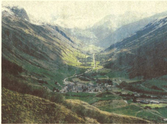
Blick ins Ursental über Realp Richtung Hospental: Das Gebiet soll Teil der geplanten Biosphäre werden.