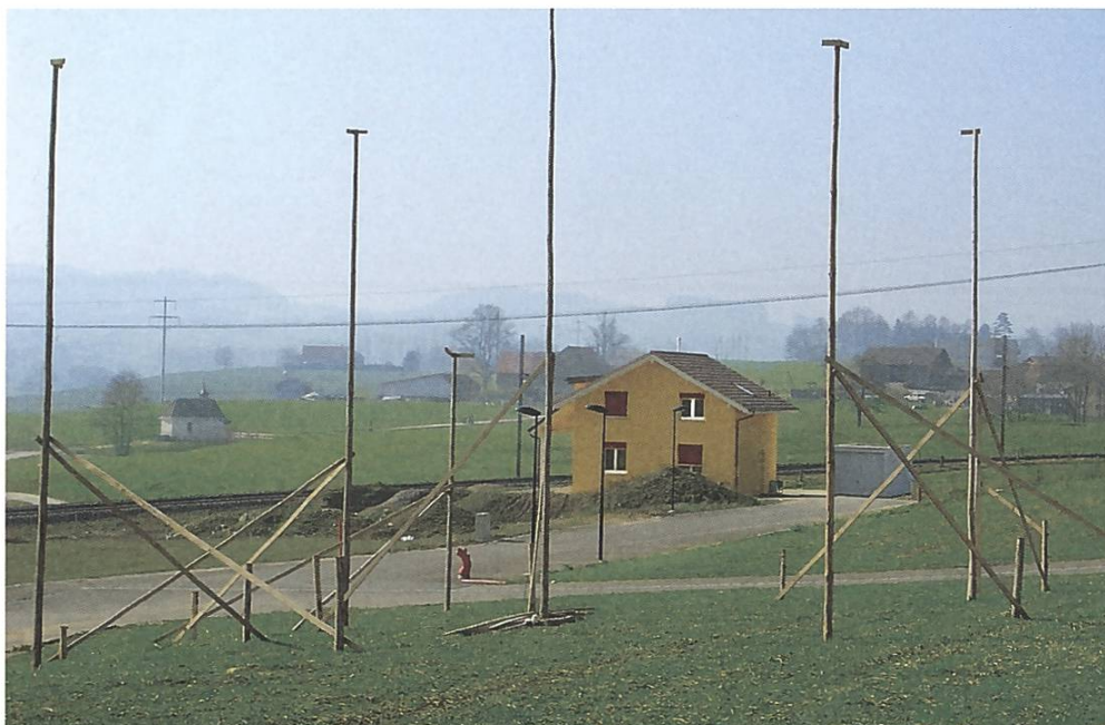
Die Zersiedelung schreitet fort (Beispiel Romont FR)

Die Chancen für eine griffige Raumplanung stehen gut. An zahlreichen Orten der Schweiz wird heftig über die Siedlungsentwicklung diskutiert und sehr häufig werden neue Bauzonen auch von der Bevölkerung abgelehnt. Die Schlagzeilen widerspiegeln dies entsprechend: «Im Appenzell wehrt man sich gegen den <Siedlungsbrei> («Südostschweiz»), «Wirkungslose Raumplanung» («Walliser Bote»), «Stimmvolk will keine Sonderzonen für Reiche» («Südostschweiz») u.a.