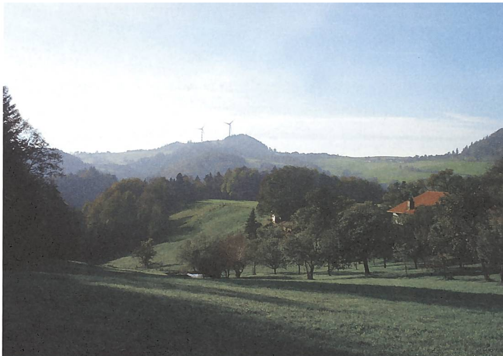
Die Windräder von Saint-Brais JU