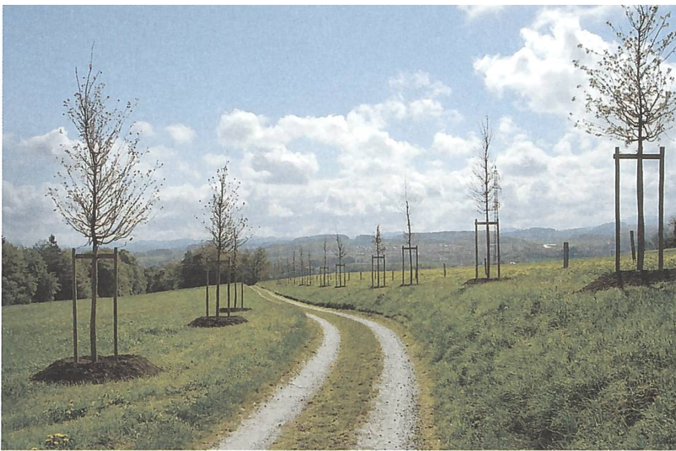
Die neue Eichenallee von Barberêche FR