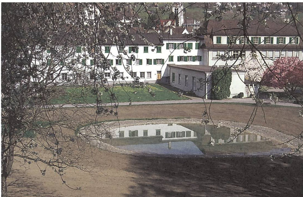
Blick auf das Klosterareal Maria Hilf in Altstätten SG