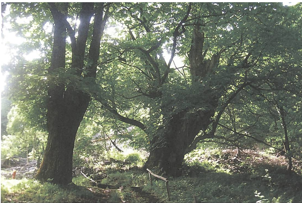
Mächtige Kastanien in Dunzio TI