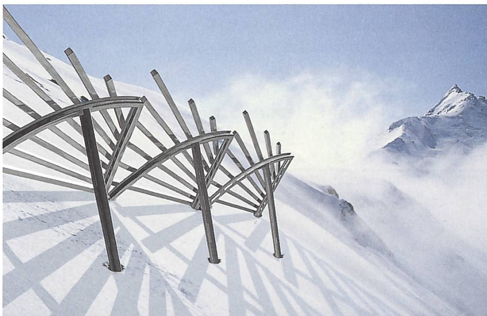
«Alvar» – prämierte Studie zu einer neuartigen Lawinenverbauung