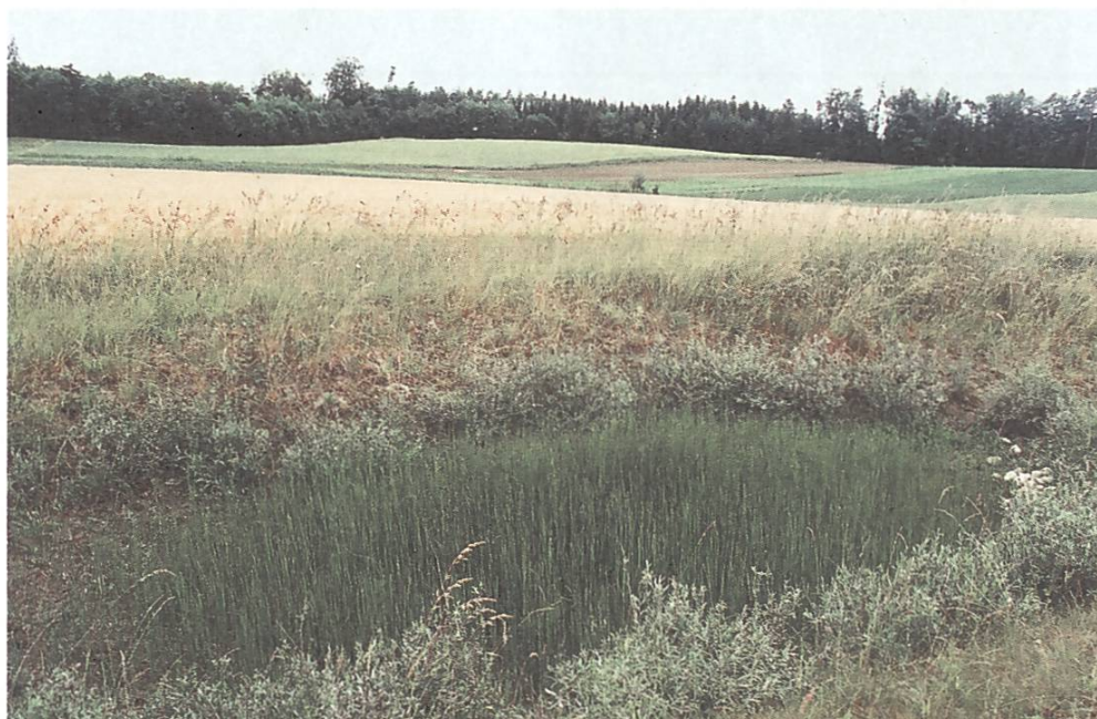
Neue Naturvielfalt auf dem Ulmizer Plateau FR

Der Deutschfreiburger Landschaftspreis ist ein wichtiger Motor der breiten Sensibilisierung und wurde daher auch Vorbild für die Auszeichnung «Landschaft des Jahres» der SL.