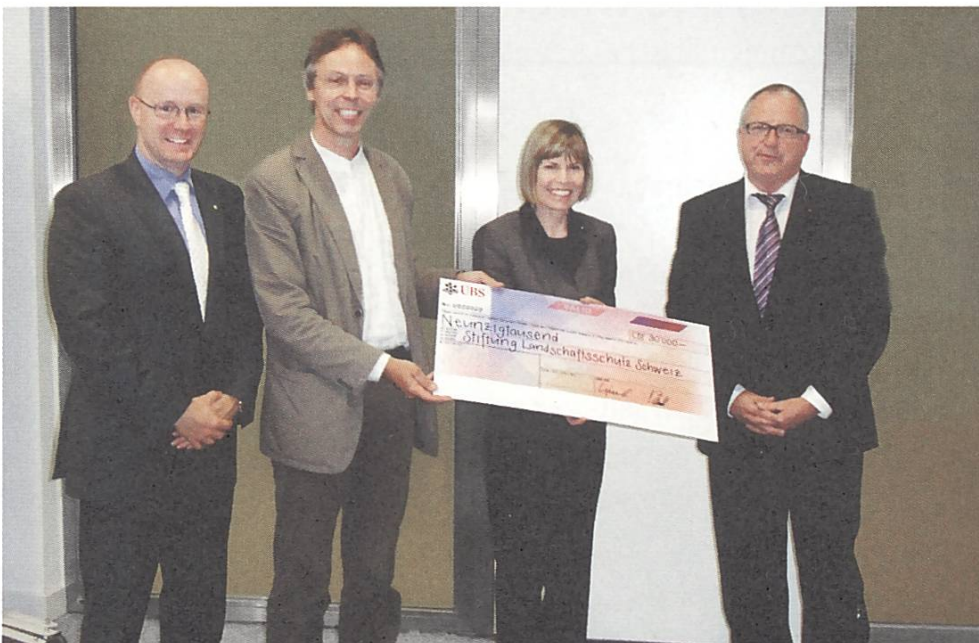
Übergabe des UBS-Schecks an die Präsidentin

Die SL kann seit Jahren auf eine hervorragende Medienpräsenz bauen. Unsere Mitarbeitenden sind gefragte Interviewpartner. In Zeitungen, Radio und Internetportalen können ihre Anliegen, Erfolge, Projekte und Forderungen auf nationaler wie auch regionaler Ebene eingebracht werden. Erwähnenswert sind auch eigene Artikel in regelmässiger Folge, wie in der «Neuen Zürcher Zeitung», oder auch Kolumnen, z.B. in der «Hotel Revue», oder Blogs. So wurden 2011 insgesamt 57 (Vorjahr: 55) Medienmitteilungen im Namen der SL verschickt. Zusätzlich wurden 4 Medienkonferenzen durchgeführt: Am 24. Februar 2011 in Biel stand das Thema Beschwerde gegen den