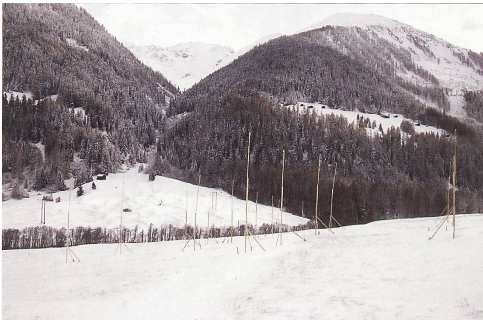
Baugespanne in Geschinen VS