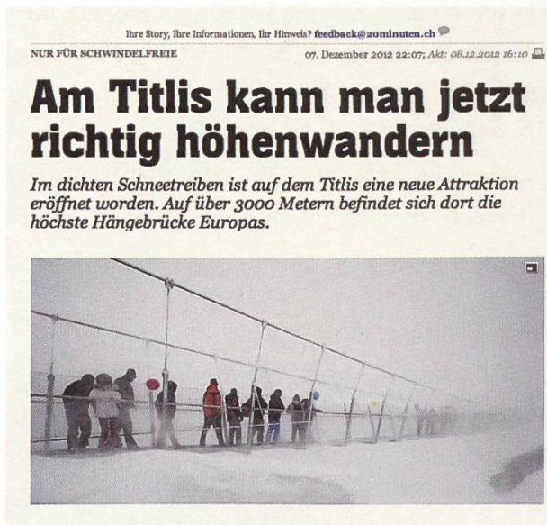
Die fragwürdige Hängebrücke am Titlis

Massive Aussichtsplattformen oder Hängebrücken wie auf dem Titlis werden die Alpen zu Modebergen machen. Ein tiefes sinnliches Naturerlebnis findet dort bestimmt nicht statt.