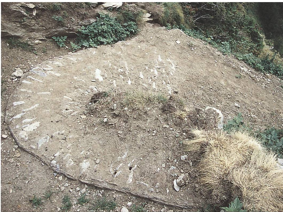
Hangerechte Sanierung des Erilweges mit Steinbicki