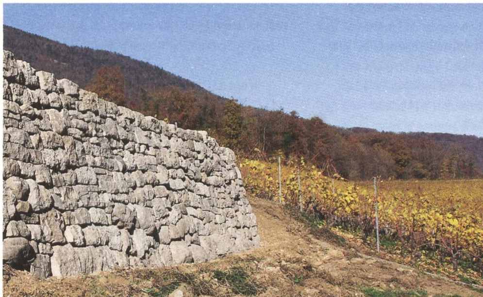
Sanierung von Rebmauern in Onnens VD

Viele Trockensteinmauern im Weinberg sind in den letzten Jahrzehnten verschwunden. Es ist daher dringend, die noch bestehenden traditionellen Mauerabschnitte zu erhalten. Während die Bewirtschaftung des Gebietes Chassagne und der Obstplantagen durch landschaftliche Direktzahlungen unterstützt wird, fehlt die nötige Finanzierung für die Erhaltung der Trockenmauern.