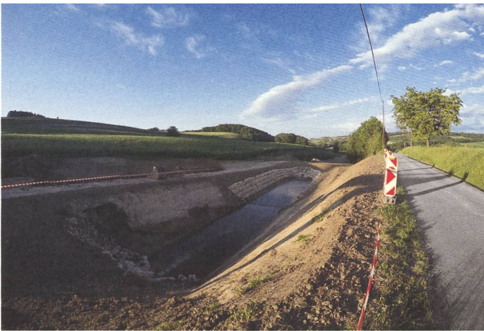
Das neue Feuchtbiotop in Treytorrens