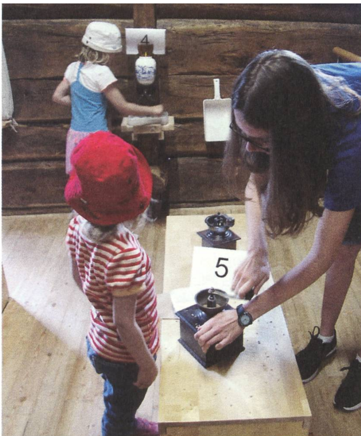
Mahlerlebnis für Schulkinder