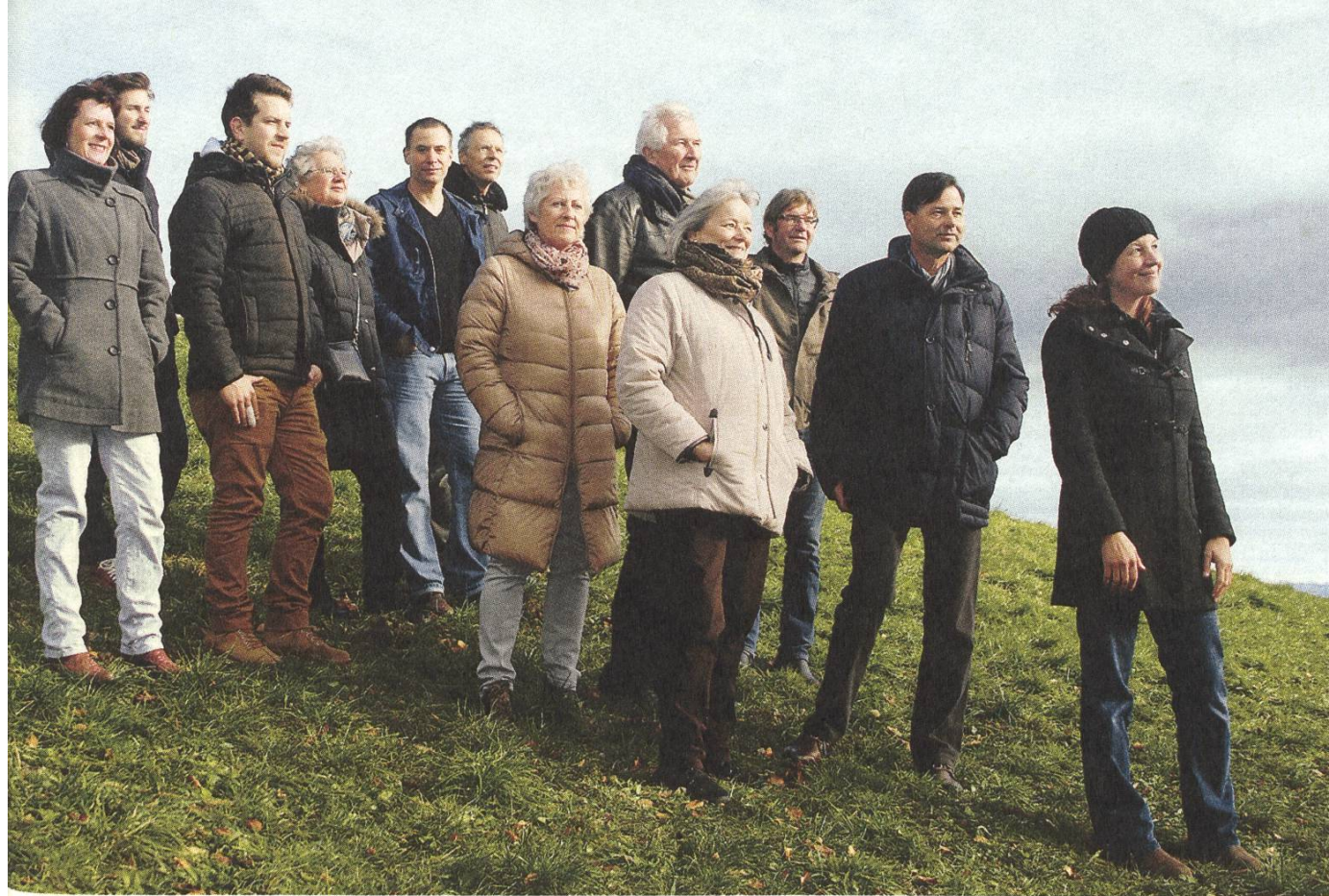
Das Team der SL. L'équipe du secrétariat de la FP.