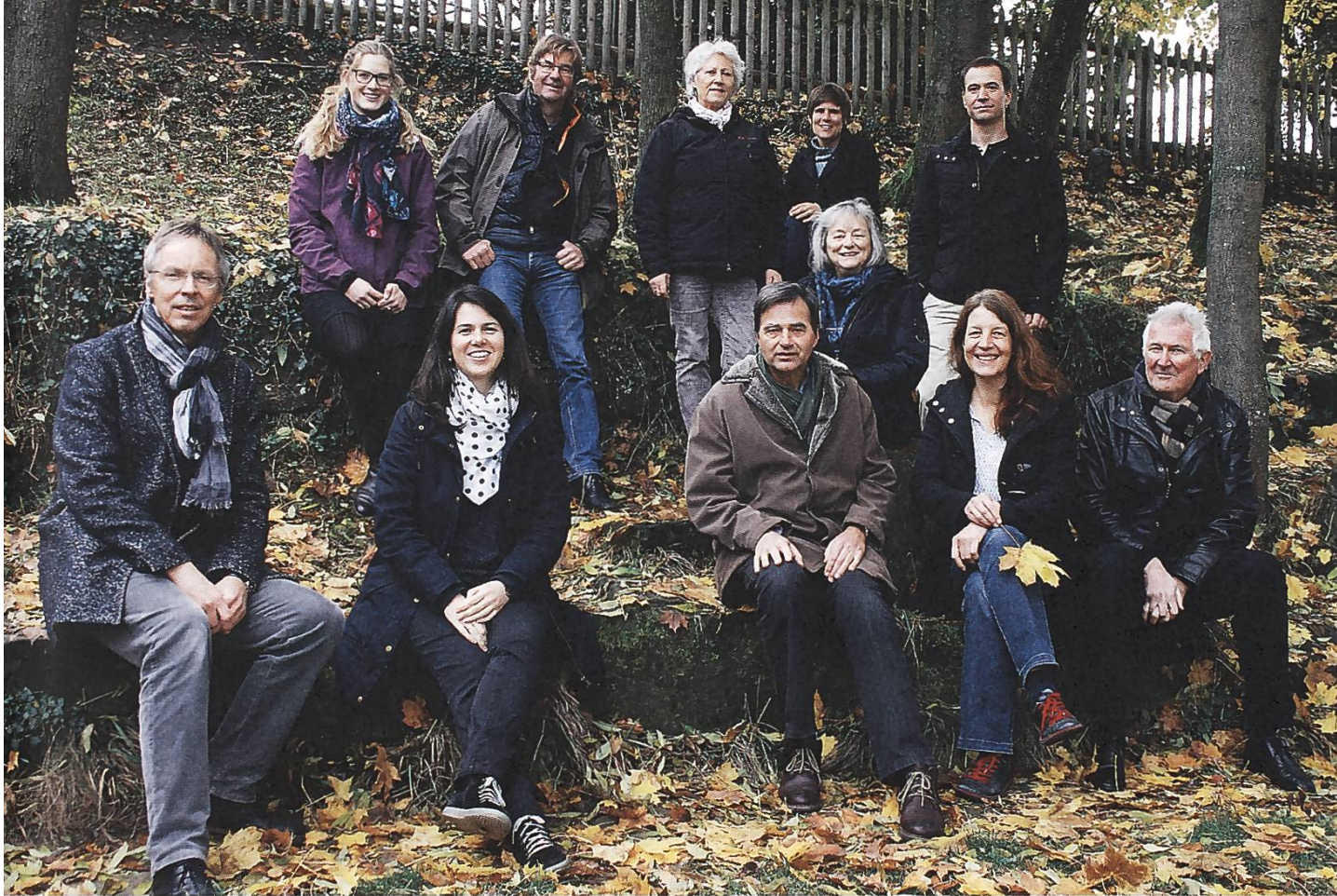
Das Team der SL. L'équipe du secrétariat de la FP.