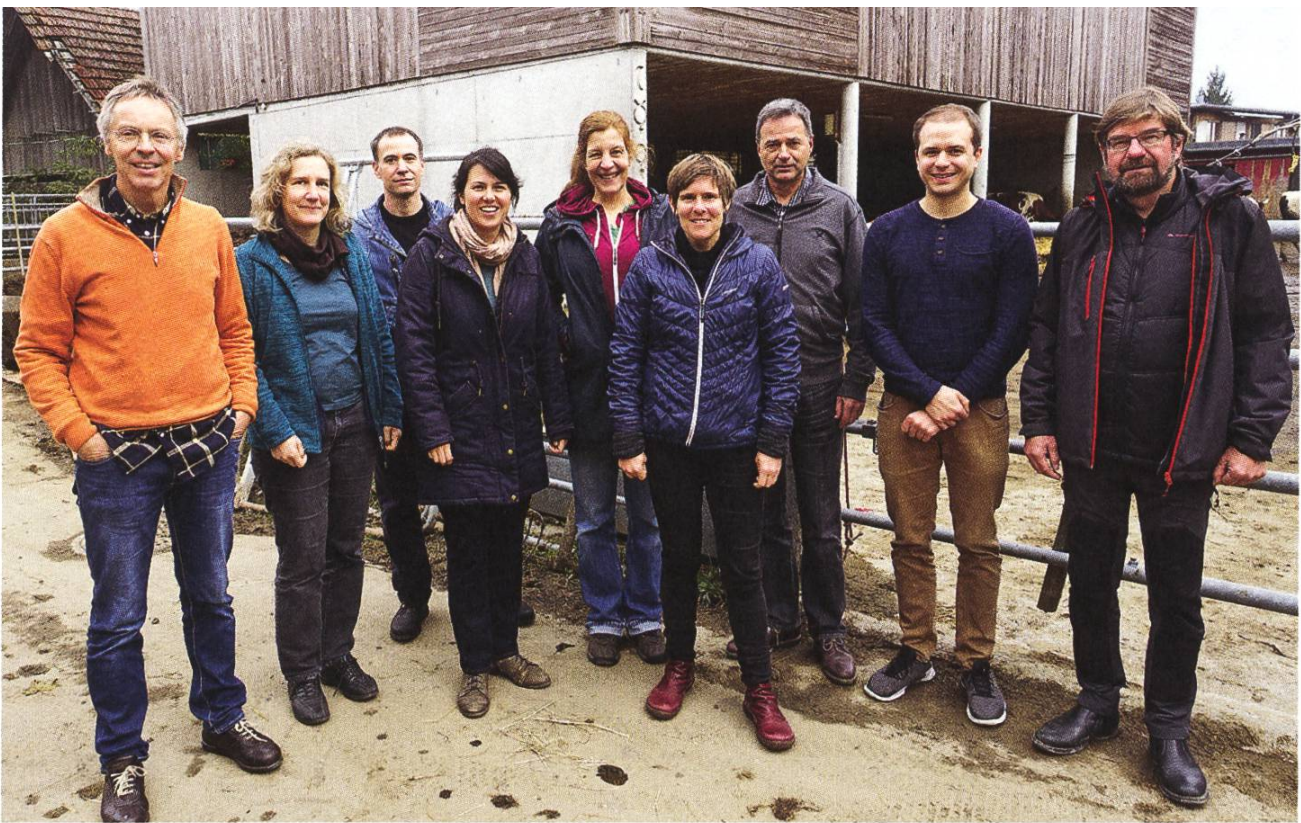
Das Team der SL. L'équipe de la FP.