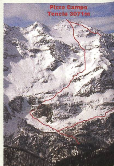
Una montagna finora priva di impianti simili

Viene poi sollevato il fatto che, nel caso in oggetto, manchi il vincolo di un'ubicazione al di fuori della zona edificabile. Secondo la Legge sulla pianificazione del territorio determinati edifici e impianti per motivi oggettivi sono destinati a ubicazioni vincolate alle zone non edificabili.