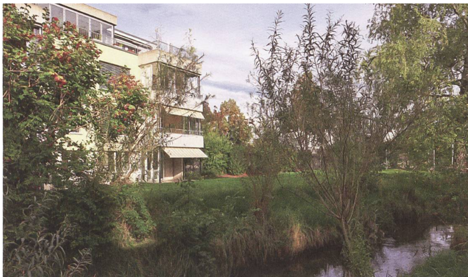
Attraktive Neubauquartiere bei den Giessen in Aarenähe, Münsingen BE