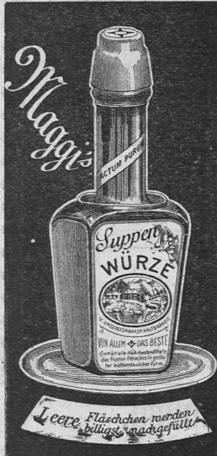
[O V 378]

Für die Abonnenten der „Schweizer. Lehrerzeitung.“ Schweizerische Portrait-Galerie.