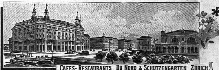
CAFES-RESTAURANTS DU NORD & SCHÜTZENGARTEN ZÜRICH