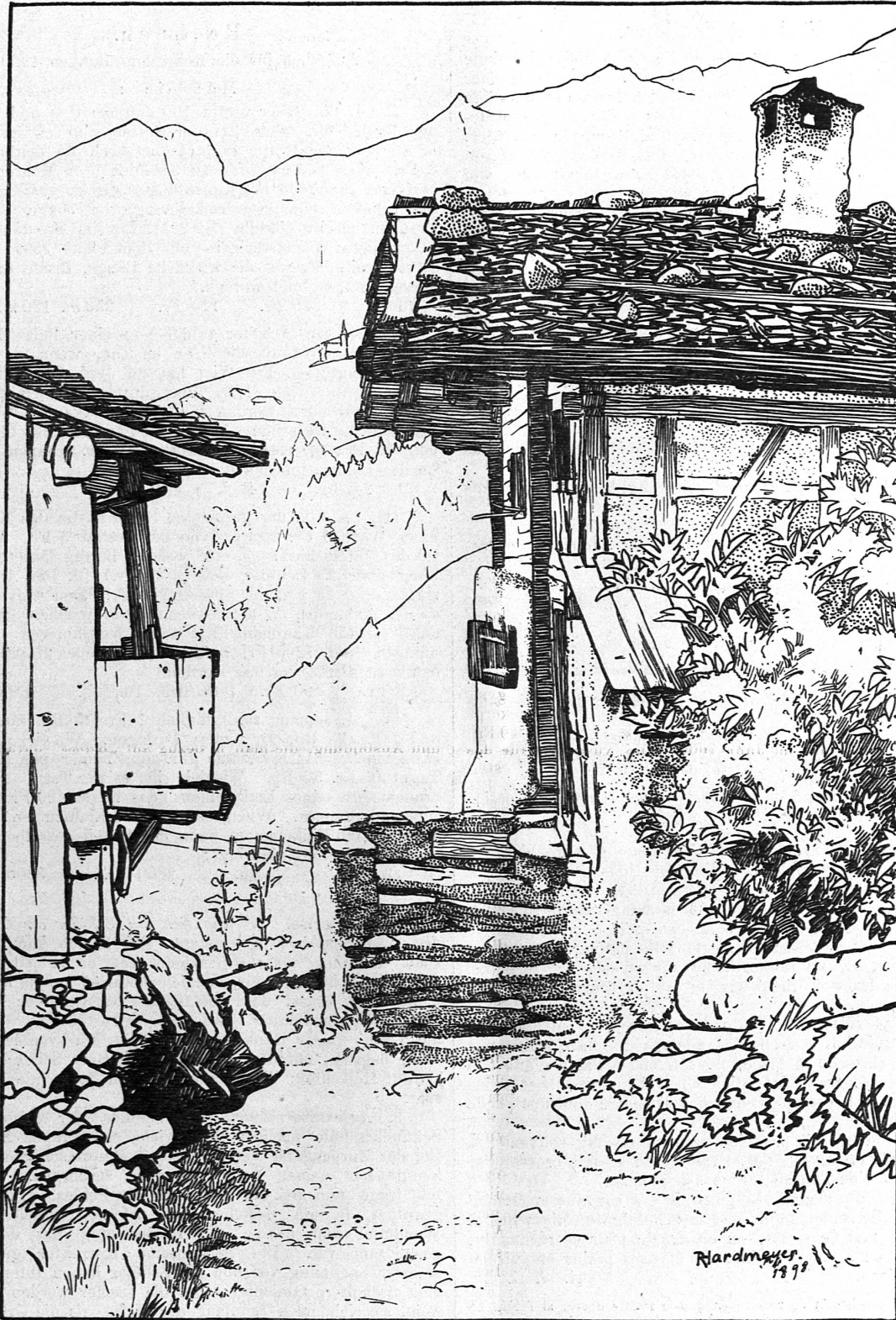
Aus: Die Schweiz.