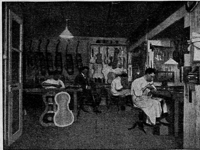
Atelier der Firma Hug & Co. für Kunstgeigenbau.