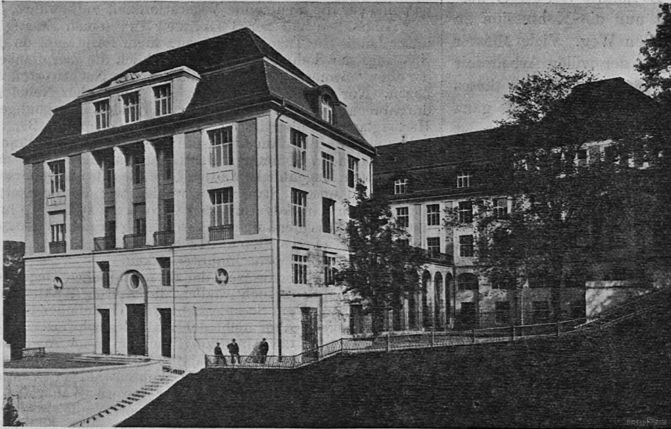
Höhere Töchterschule in Zürich: Vorderansicht gegen die Rämistrasse.

mit zahlreichen, schwarzen, flachskugeligen Beeren besetzt, die namentlich in Südfrankreich zum Färben des Weines Verwendung finden. Aus dem Waldesdunkel leuchten rote Cyclamen heraus, deren prächtige Blüten mit ihrem Wohlgeruch die Aufmerksamkeit des Spaziergängers auf sich lenken.