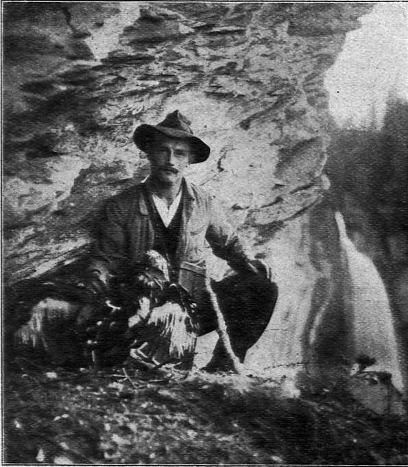
Junger Adler im Horst (Weißtännental).

In No. 32 der S. L.-Z. machte Hr. Dr. Brenner in Basel auf photographische Aufnahmen eines Adlerhorstes aufmerksam. Wir bringen hier die Reproduktion einer jener Aufnahmen.