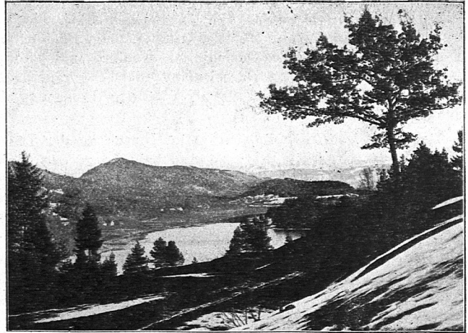
Vorfrühling am Türlersee. Blick vom Äugsterberg gegen Süden. Erklärung: (Vorfrühling) Türlersee, Türlen, Riedmatt, Oberalbis mit Bürglenstutz, Alpenkette.

3. Am 6. Juni begannen wir das Hauptwerk! Der Lehrer brachte uns einen Plan, der doppelt so groß war als die an-