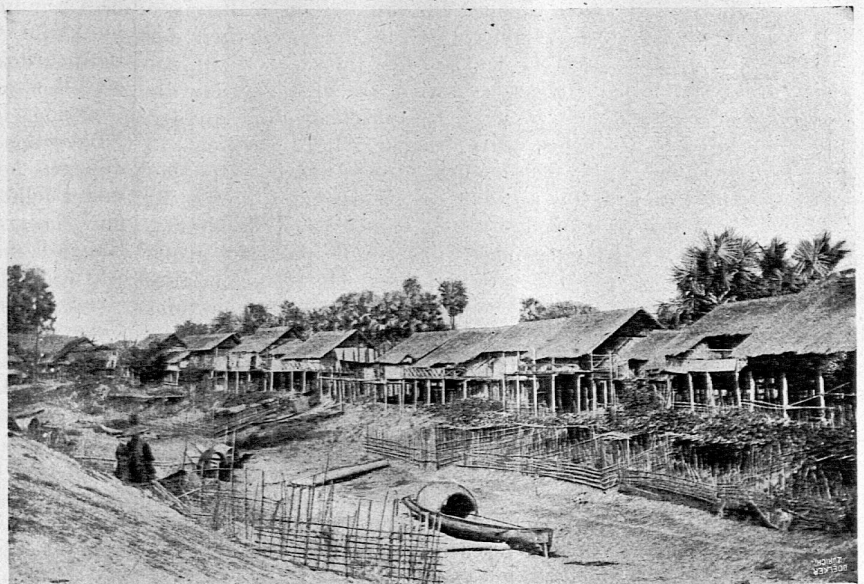
Burmanische Siedlung am oberen Irawadi.

(Vor den Häusern Lauben. Zur Regenzeit reicht das Wasser bis zu den Terrassen.)