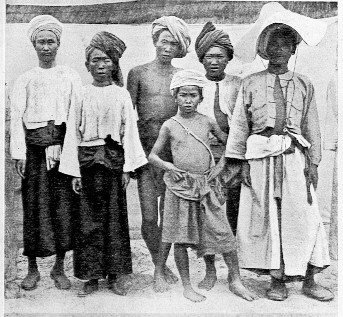
Shan aus Hsenswi.

Das Bergland im Norden weist Hochgebirgscharakter auf. Wildzerrissene Käme reihen sich aneinander, und zwischen ihnen graben sich die wilden Ströme ihr steilwandiges Bett. Reiche Niederschläge befeuchten die Hänge und zaubern einen Bergwald hervor mit prächtigen Baumriesen, einem Gewirr von Schlingpflanzen und dichtem Unterholz. Trotz der reichen Niederschläge, der üppigen Vegetation und dem gesunden Klima sind diese Gegenden schwach bevölkert. Eingeborenstämme treiben einen höchst primitiven Ackerbau in sogenannten Rodungskulturen.*) Im Süden der Bergländer dehnen sich zwischen dem Shanhochland und den westburmanischen Ketten die Ebenen von Ober-Burma aus. Sie sind das Produkt der wasser- und geschiebereichen Flüsse. Diese Böden sind sehr fruchtbar. Die nötige Feuchtigkeit liefern die Flüsse mit ihren alljährlichen Überschwemmungen und zahlreiche künstliche Bewässerungsanlagen. Die größte Ausdehnung erreichen diese Alluvialböden beim Zusammenfluß von Chindwin und Irawadi, bei Mandalay. Der Irawadi, der im Berglande entspringt, wird nach einem kurzen Oberlaufe, bei Bhamo, noch 1900 km von seiner Mündung entfernt, schiffbar. Er durchströmt in imposanter Breite die zu gewaltigen Ebenen ausgedehnten Talböden. An 3 Stellen durchbricht der Strom in sog. Défilés Gebirgszüge, die sich ihm hindernd in den Weg stellen. Dort verengt sich dann das Flußbett bis auf 40 m. Diese Stromengen stauen das Wasser zur Regen-