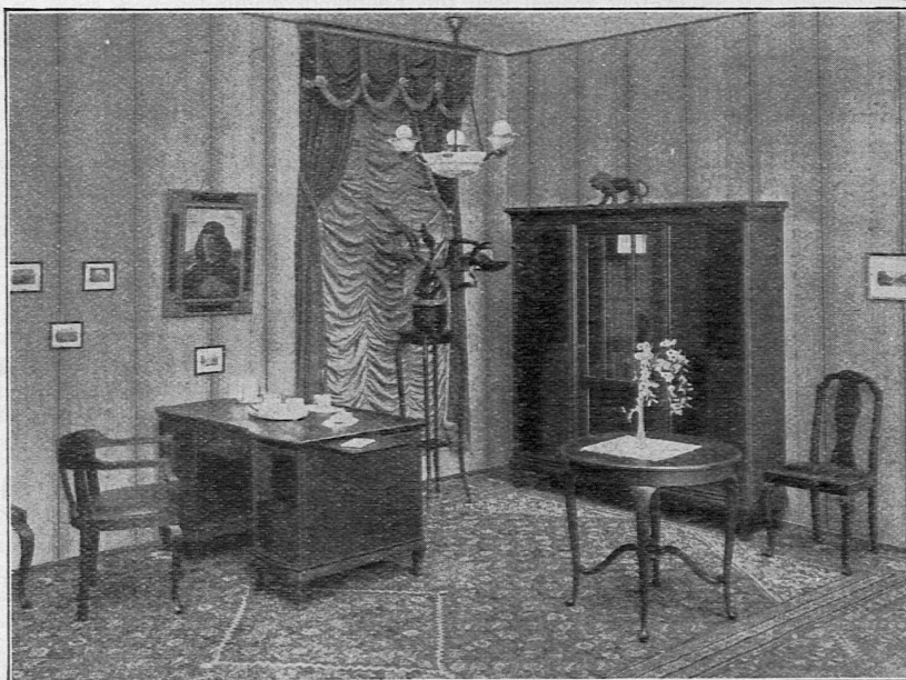
Herrenzimmer No. 2503 in Eiche frisé, antik gebeizt, mattiert. Ein prächtiges Modell in weichen, schmiegsamen Formen. Die bombierte Mitteltüre des Bücherschranks hat unten eine Nussbaummaser-Einlage. Sie gibt dem Schrank etwas reizvolles, persönliches. Aussergewöhnlich anmutig ist die vordere Linie des Schreibtisches. Dieses Möbel gewinnt noch durch die kunstvoll zusammengearbeitete Platte. Zum Herrenzimmer gehören: Bücherschrank, Schreibtisch, runder Tisch mit Tablar oder Versprossung, Schreibtischessel und zwei Polsterstühle. Diese Einrichtung ist in allen Teilen sorgfältig und gewissenhaft ausgeschafft, und wird mit langjähriger Garantie abgegeben. Fragen Sie bitte den Preis, er wird Sie überraschen.

Wünschen Sie eine allgemeine Übersicht, dann verlangen Sie noch heute unsere photographischen Prospekte, indem Sie untenstehenden Coupon einsenden.