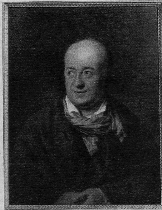
Salomon Geßner 1730–1788