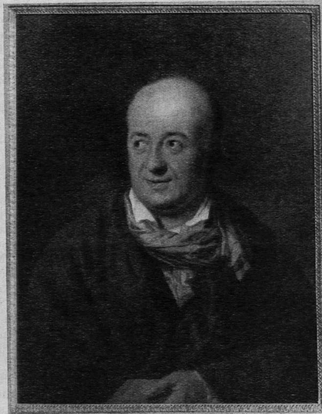
Salomon Geßner 1730–1788