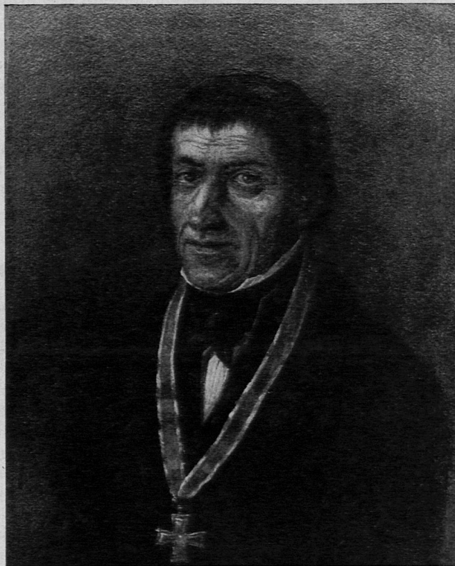
Melchior Mohr 1762—1846

Helv. Minister der Künste und Wissenschaften, 1800. Chorherr und Schulinspektor in Luzern.