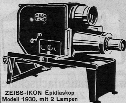
ZEISS-IKON Epidiaskop Modell 1930, mit 2 Lampen Fr. 770.—