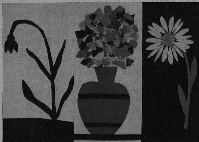
[Schneeglöcklein Blumenstrauß Marguerite]

b) Ausreissen : Obstformen, Blattformen, Blumenstrauß, Kranz, Vogelscheuche.