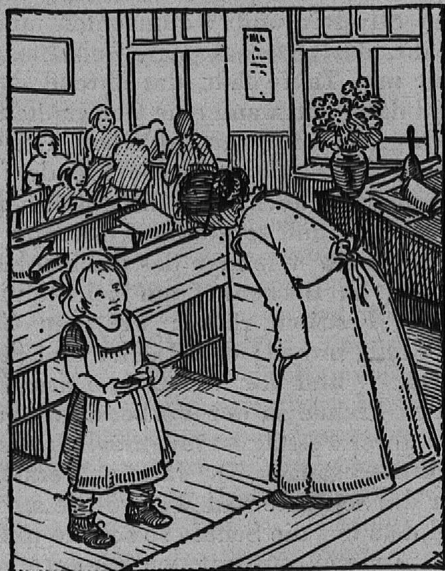
Was söll i dermit

Es lüetet. Mit eim Ruck steit d'Jumpfer Wunderlech uf. Sie geit a d'Tafele u löscht mit ere einzige Bewegung die stränge Schuelmeisterzahle us. Sie sitzt a ds Harmonium u faht afa spile. Z'erst lysli, nachär geng luter: «Ihr Kinderlein kommet — o kommet doch all!» — D'Chinderstimme si na di na ygfalle.