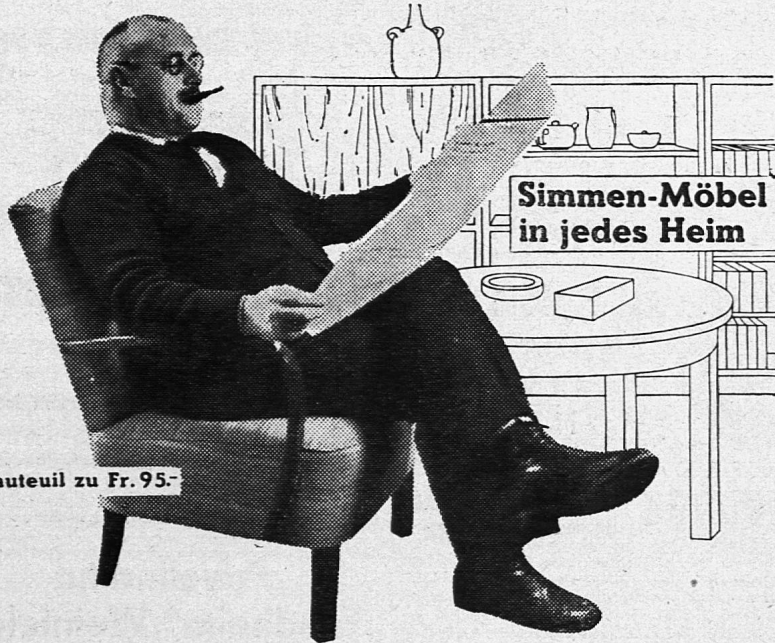
Fauteuil zu Fr. 95.-