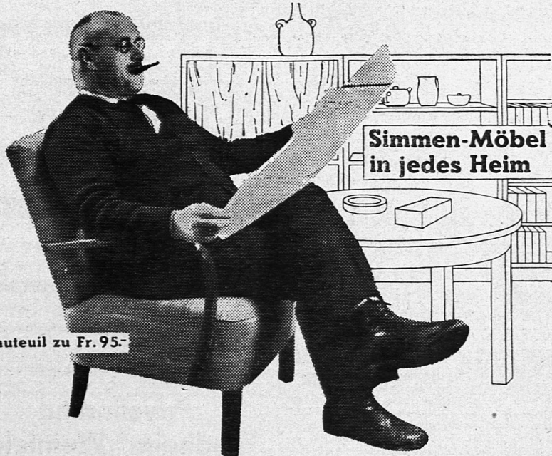
Fauteuil zu Fr. 95.-