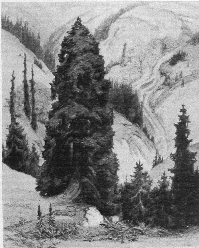
Karl Itchner: «Tanne am Abhang». Oelgemälde, im Besitze des Pestalozzianums, Zürich.

aufs neue den Glauben an die Menschheit, in Zeiten der Verwirrung und des unaussprechlichen Egoismus einen Mann zu sehen, der von einem solchen Geiste beseelt, und mit der seltensten Menschenkenntniss ausgerüstet, die Quellen der Verwilderung unseres Volkes erforscht, und der nun, so wie er die fürchterlichste derselben in der Art des ihm von Jugend auf ertheilten Unterrichtes entdeckt, mit Aufopferung seiner Ruhe und jedes Lebensgenusses daran arbeitet, sie zu verstopfen, die Gewissen der Eltern und Lehrer zu erschüttern und ihnen zu zeigen, wie und wohin die Kinder geleitet werden müssen. Es bedarf nicht nur eines Herzens voll Wohlwollen, sondern auch der Stärke der Seele, am Abend seines Lebens noch eine solche Arbeit zu ergreifen, sie in ihrem kleinsten Detail zu