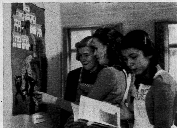
Schülerinnen betrachten eine Arbeit der Klasse Cleis-Vela

Wie sehr das Pestalozzianum als im Dienste der Allgemeinheit stehend empfunden wird, beweist ein Gesuch des Schweizerischen Roten Kreuzes, unser Institut möchte seine Räume für die Bücherausgabe an französische Flüchtlingskinder zur Verfügung stellen. So bescheiden unsere Raumverhältnisse sind: wir haben dem Gesuch entsprochen; und nun holen jeden Donnerstagnachmittag 60—80 solcher Kinder ihre Wochenlektüre im Pestalozzianum ab und beleben mit ihrem französischen Temperament unsere Räume.