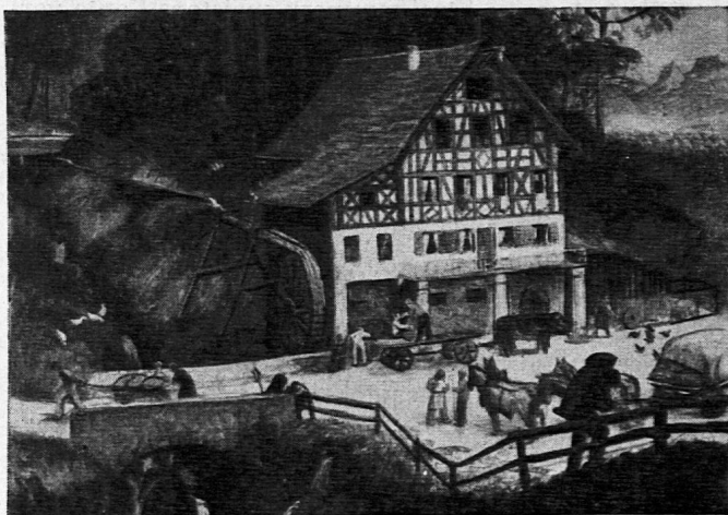
Maler: Reinhold Kündig, Horgen

Die hier schon einmal ausführlich angezeigte XI. Bildfolge des SSW — wie offiziell das Schweizerische Schulwandbilderwerk benannt wird — ist abgabebereit. Seit Jahren wird immer wieder vergeblich versucht, den am grünen Tisch ausgeheckten Terminkalender einzuhalten, um im Juli mit dem Versand der Bilder beginnen zu können, inbegriffen die Kommentare, die gleichzeitig abgehen müssen. Trotzdem ist eine «kleine Verspätung» von fast zwei Monaten längst Tradition geworden. Meist waren die Kommentare