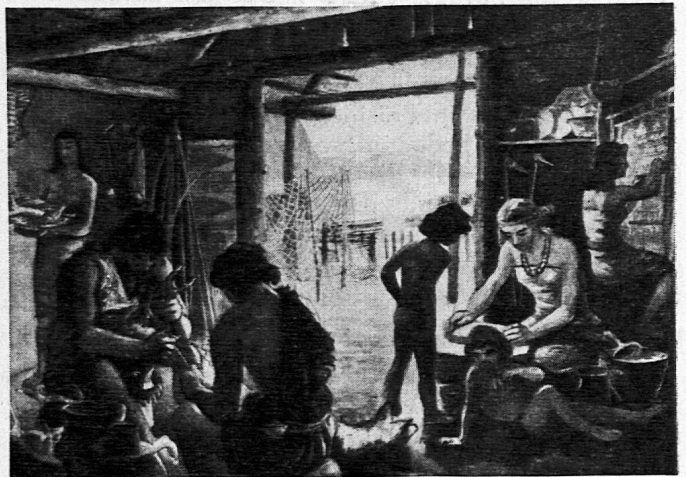
Maler: Paul Eichenberger, Beinwil am See.

Damit sei die neue Kommentarreihe mit den neuen Bildern 49—52, denen wir eine gute Aufnahme wünschen, auf den Weg gegeben, damit sich die Arbeit schöpferischer Kollegen in weitem Masse auswirke.