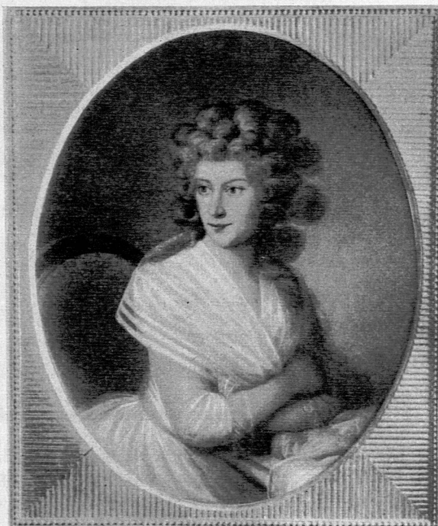
Magdalene Charlotte Hedevig Grevinde Schimmelmann, f. od. Schubart

Auf Ströms Vorschlag wurde durch Königliche Resolution vom 25. November 1803 an der «Vor Frue»-Schule in Kopenhagen ein Pestalozzisches Versuchsin-