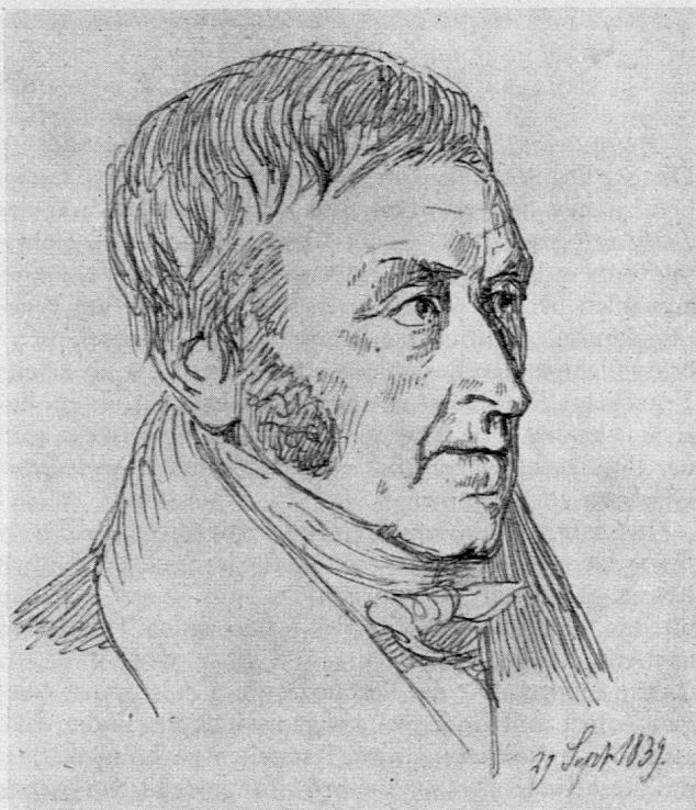
Christian Ludvig Ström (1771—1859) Lehrer am Blaagard-Lehrerseminar, besuchte Pestalozzi in Burgdorf 1803

grosse Neubauten statt, und im folgenden Jahr wurde in Lenzburg eine Filiale errichtet. Gegen Ende des Jahrhunderts soll die Fabrik bis 120 Drucktische besessen haben. Pestalozzi hat (soweit ersichtlich) in den Jahren 1784—1802 auf dem Neuhof für die Wildegger Firma arbeiten lassen. Neben Hauspersonal, Malermeister, Stückträger und Farbholer, verwendete er dafür Kinder der Umgebung, die zu Hause wohnten. Welche Teile der Fabrikation als Hausarbeit besorgt wurden (Appretur), ist nicht genau ersichtlich. Jedenfalls arbeiteten die Angestellten sowohl mit Drucktischen als mit Handmalerei; im August 1784 scheint der Anfang gemacht worden zu sein.» (3. Band, Seite 482).