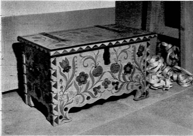
Zur Ausstellung «Der werktätige Lehrer»

Besonderer Dank gebührt den Kommissionen , die im Dienste des Pestalozzianums eine oft anspruchsvolle Arbeit zu bewältigen haben. Das gilt vor allem von der Bibliothekskommission , die aus den zahlreichen Ansichtsendungen das für uns Notwendige und Wertvolle auszuwählen hat, aber auch in eigener Initiative auf Neuerscheinungen aufmerksam macht. Ein «Wunschbuch» ermöglicht es den Besuchern unseres Instituts, ihrerseits Vorschläge für Neuanschaffungen zu machen. — Im Berichtsjahr hat eine besondere Studienkommission sich der Publikationen und Bilder zum Unterricht in biblischer Geschichte angenommen.