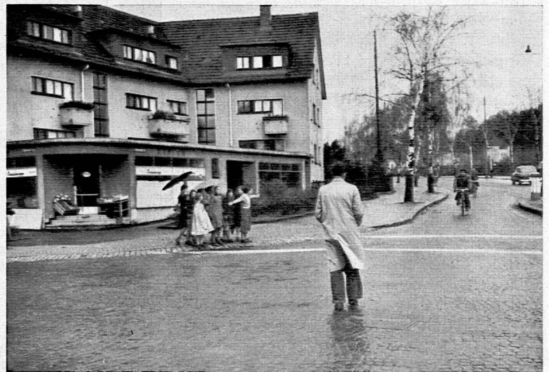
Mit der Zeit dürften solche Bilder verschwinden; denn die Erwachsenen werden zweifellos — bewusst oder unbewusst — durch das gute Beispiel der Kinder lernen, dass man die Strasse auf dem Fussgängerstreifen überqueren soll (Zürich).