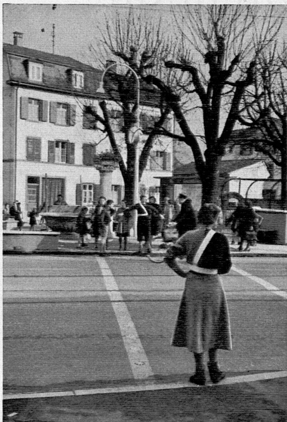
Besonders um die Mittagszeit ist diese Ausfallstrasse sehr belebt. Es mag daher nicht überraschen, dass man sich gerade hier den Schülerverkehrsdienst nicht mehr wegdenken kann (Birsfelden).

Die Verkehrsposten nehmen ihren Dienst sehr ernst, und sie legen Wert darauf, dass ein genauer Dienstplan aufgestellt wird, damit ja keiner vergisst, wann er anzutreten hat (Paudex).