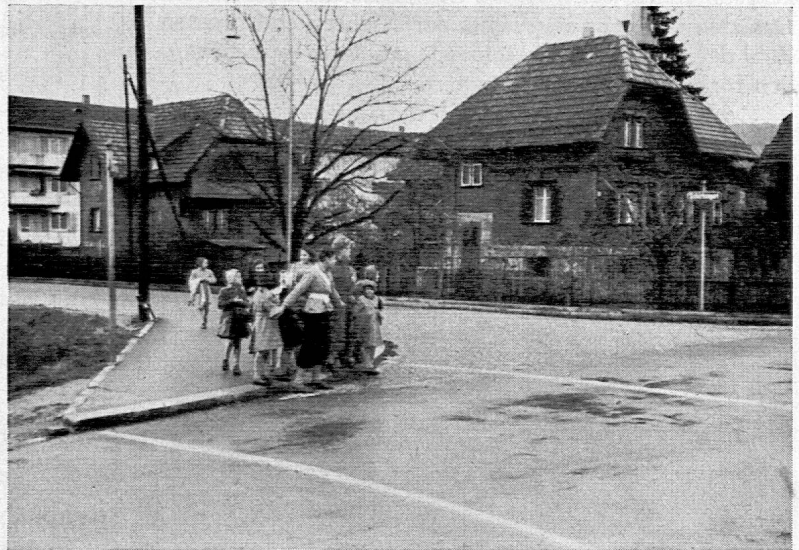
Nur zu gerne begeben sich die Kleinen unter den Schutz des Verkehrspostens, der ihnen im richtigen Moment das Überschreiten der Strasse gestattet und ihnen gleichzeitig auch die Warnung mit auf den Heimweg gibt: «Lueg links, lueg rechts!». (Zürich).