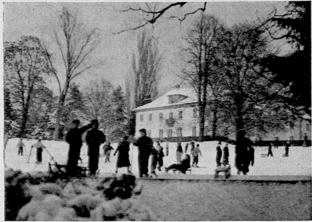
Wintersport im Beckenhofgut — Januar 1954

Unser warmer Dank gilt auch all den Mitgliedern, die unser Institut durch ihren Jahresbeitrag unterstützen. Die Erhöhung war nicht mehr zu vermeiden, um so dankbarer sind wir für die Einlösung. Auch heute noch darf dieser Beitrag als bescheiden bezeichnet werden im Vergleich zu dem, was das Pestalozzianum durch den Ausbau der Bibliothek, den Ausleihdienst von Büchern und Bildern und durch seine Auskünfte und Ausstellungen leistet. Einen ganz besonderen Dank sprechen wir jenen Kollektivmitgliedern aus, die ihren Jahresbeitrag schon für 1953 erhöht haben. Es sind eine ganze Reihe von Gemeinden, die auf diese Weise Ermutigung und Anerkennung zum Ausdruck brachten. Endlich haben wir für Zuweisung von wertvollen Büchern und Dokumenten herzlich zu danken. Wertvolle Bestände sind uns durch letztwillige Verfügung aus dem Nachlass von Dr. Emil Stauber zugekommen. Auf eine ehrende Zuweisung von Briefen des Pestaloz-