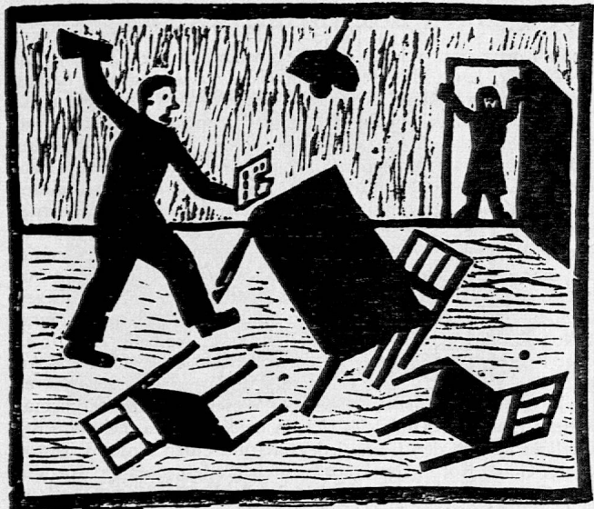
Illustration zu «Schmachschrift». Der Zorn des Amtsschreibers wird durch das wild durcheinandergewürfelte Schwarzfleckenwerk eindrücklich. Die Schnittpuren als statischer Gegensatz steigern die Wirkung. Es soll darauf geachtet werden, dass in den grossen Weissflächen der Platte nicht «irgendwie», sondern im Zusammenhang mit dem Bildaufbau, sich die Schnitfführung vollzieht. Auch die Spuren müssen sinngemäss erscheinen: Wand senkrecht, Boden waagrecht.

Unermülich soll die weitere Arbeit kontrolliert werden: Ohne Worte vorerst, dann mit bestimmten Fragen und Hinweisen, mit Gedächtnisauffrischungen über das vorher Gesagte, mit Ermunterung und Lob, nur nie mit eigentlichem Tadel, sondern «Probier's noch ein bisschen klarer, besser, schöner zu zeigen», usw. Wieder wird die Klasse vor ein gutes und ein ungeschicktes Resultat versammelt. Die Augen sind schon kritischer, und verständige Einwürfe der Schüler, durch sorgfältige Fragen gelöst, erhellen vermehrt die Zielsetzung (Darstellung des entsprechenden Textes in klarer Aussage, schön in der Schwarz-Weiss-Verteilung und werkgerecht). Wenn ein Schüler eine schwarze Fläche von einer weissen mit einer Linie trennt, zeigt er, dass er das Wesen der Fläche noch nicht begriffen hat. Man fragt ihn also nach dem Zweck dieser Linie, nach ihrer Aufgabe an solchem Platz. Er wird zugeben müssen, dass sie zur Abgrenzung überflüssig ist, da ja die schwarze und die weisse Fläche bei ihrem Zusammenstossen selber eine «Linie», eine Grenze bilden. Ich zeige auch, wie statt mit Linien ein dunkler Gegenstand innerhalb einer dunklen Fläche durch fleckenmässige Schwarz-Weiss-Aufteilung sichtbar gemacht werden kann. Wenn dann ein solcher Gegenstand aus dem Dunklen noch in eine helle Fläche überschneidet, kann er dort einfach dunkel fortgesetzt werden. Dabei ergibt sich ein reizvolles Wechselspiel von Schwarz-Weiss. (Fortsetzung folgt in Nr. 5.)