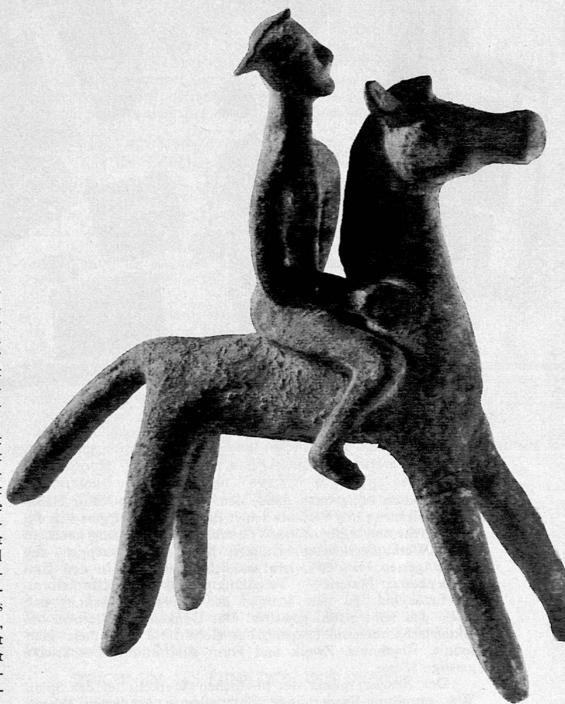
Tonstatuette eines Reiters, Korinth, 6. Jahrh. v. Chr. Galerie für antike Kunst, Zürich.

Immer muss uns begleitend sein, dass ein Werklein, sei es abstrakt graphischer Natur oder räumlich praktischer Art, aus der inneren Notwendigkeit des Werkes selbst entsteht. Der junge Formbildner schafft jeweils nur das richtig, was er kraft einer Gesamtschau seiner gegenwärtigen Vorstellungswelt jeweils auch technisch möglich lösen kann. Wo das Erleben noch einheitlich ist (Unterstufe), geht die Natur haushälterisch echt mit den Ausdrucksmitteln um. Was schön und richtig ist , muss der Lehrer immer wieder zuerst zu ergründen suchen. Heute besteht