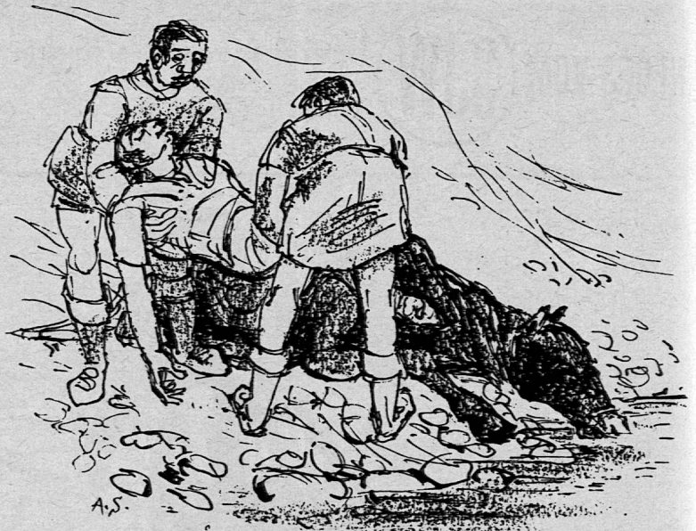
Illustration von Albert Saner aus SJW-Heft Nr. 588 «DIE XI. LEGION»

Aus SJW-Heft Nr. 587 Schatzgräber im Indianerland von Illa Beerli Reihe: Reisen und Abenteuer Alter: von 11 Jahren an Illustrationen: Willi Schnabel