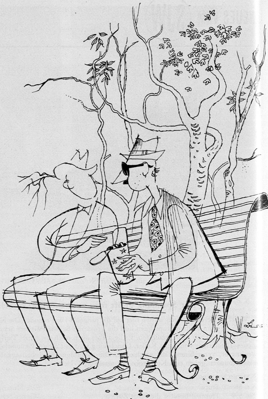
Illustration von Hugo Laubi aus SJW-Heft Nr. 599 «HUPFAUF BESUCHT DIE STADT ZÜRICH»

«Nun, ich denke, Sie haben mich doch gesehen.»