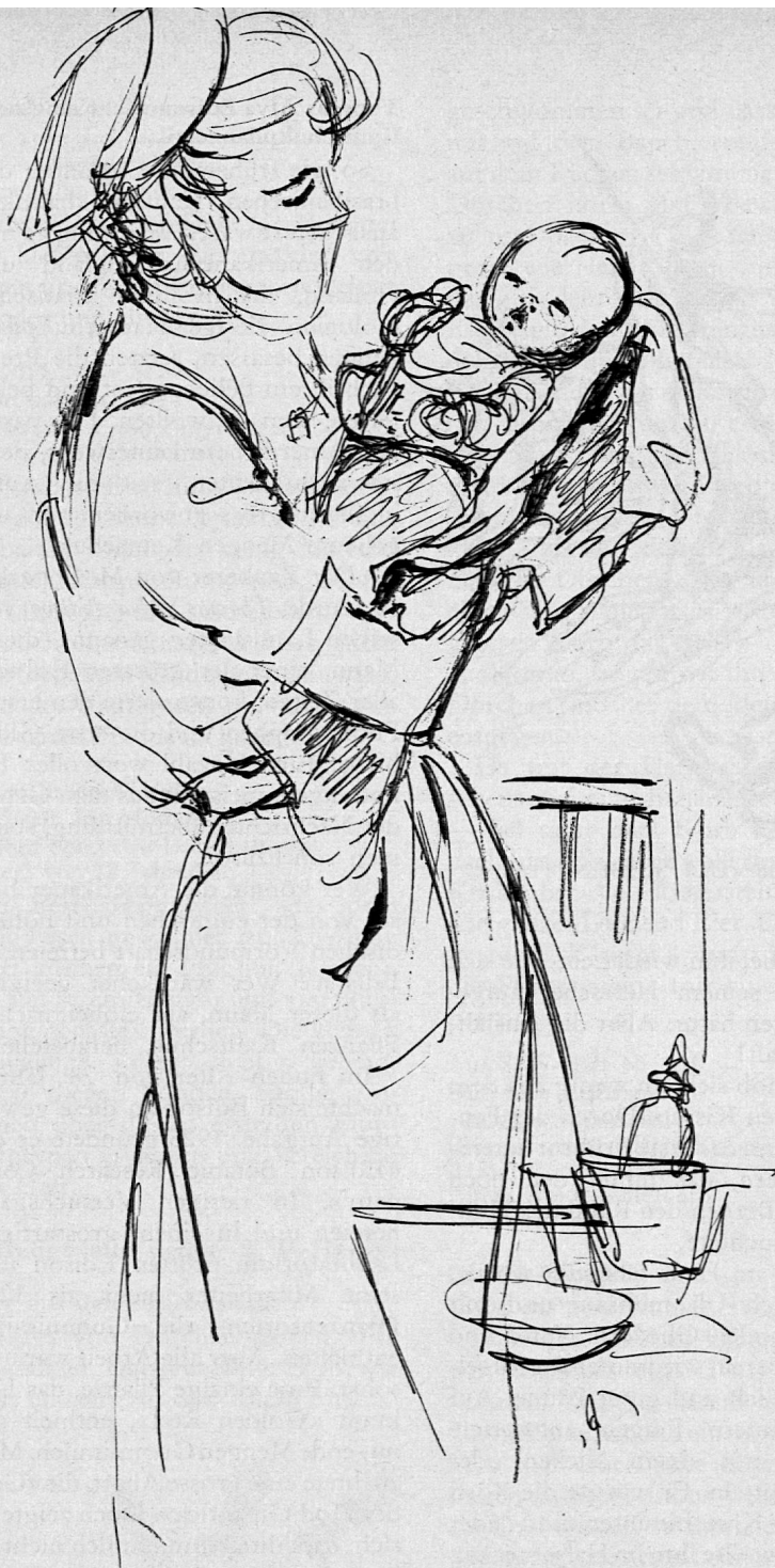
Illustration von Margarete Lipps aus SJW-Heft Nr. 600 «KÄTTI WIRD SCHWESTER»

Horch, da schrillt das Telephon! Ich renne. Wahrscheinlich eine Frau, die zur Geburt kommen will. So ist es. Der Mann ist am Telephon. Ich erkundige mich genau nach allem und schreibe es gleich auf. Dann lege ich Bettflaschen in das Bett, das sie aufnehmen soll und öffne die Haustüre. Inzwischen läutet es oben im zweiten Stock. Frau B. kann nicht schlafen, es ist ihr so bang: «O liebi Schwöschter, hälfed mer!»