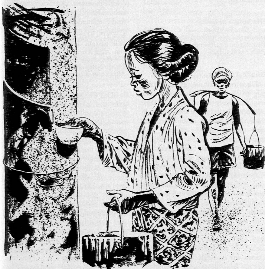
Illustration von Willi Schnabel aus SJW-Heft Nr. 609 «GEHEIMNISSE UM DEN KAUTSCHUK»

Nr. 609 Hans Ulrich Jucker Geheimnisse um den Kautschuk Reihe: Technik und Verkehr Alter: von 12 Jahren an Eine kleine Monographie über den