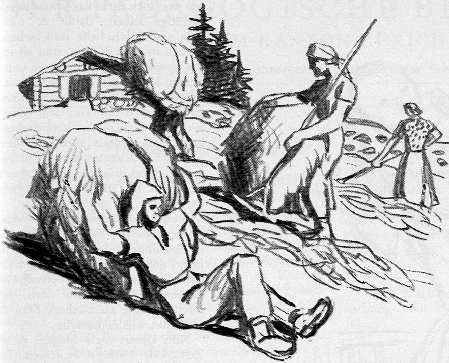
Illustration von Fred Stauffer aus SJW-Heft Nr. 608 «ULI SIEBENTHAL»