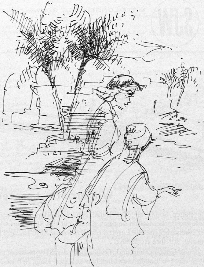
Illustration von Harriette Klaiber aus SJW-Heft Nr. 655 «Mustapha, ein tunesischer Knabe»

Toni, dessen Vater Pilot ist, taucht ein kleines Flugzeug, das im Hangar neben dem grossen steht, auf den Namen «Luftibus». Mit diesem «Luftibus» unternimmt der Knabe einen Flug, der den Tollkühnen über die Alpen nach Mailand führt. Die Geschichte, für kleinere Leser geschrieben, schaukelt vergnügt zwischen Unwahrscheinlichem und Möglichem hin und her und ist eigentlich ein spassiges kleines Märchen von einem kleinen Knaben, der Freude am Fliegen hat.