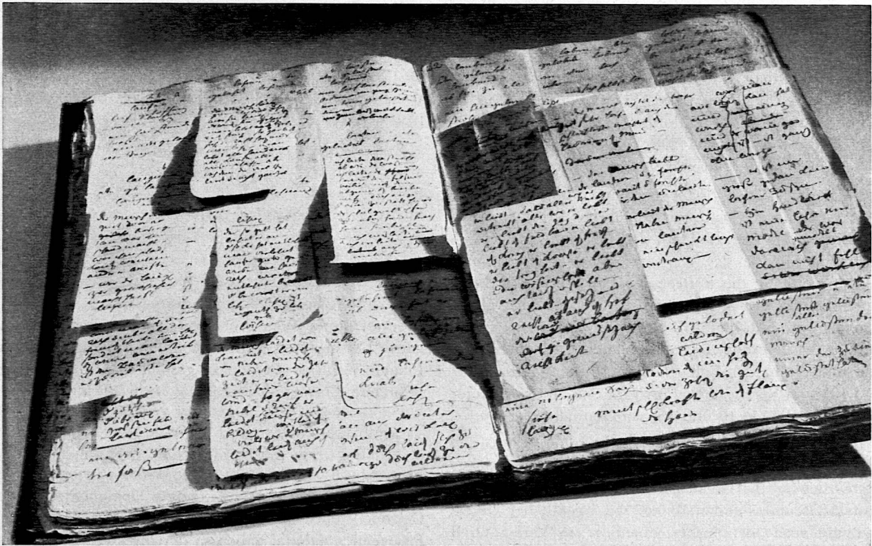
«Der natürliche Schulmeister». Beispiel von der Anlage des Manuskriptes mit den vielen nachträglich eingesetzten Hilfs- und Ergänzungzetteln

unterbreiteten Entwürfen einhellig zu, da uns die Belange der Landschulen berücksichtigt erschienen.