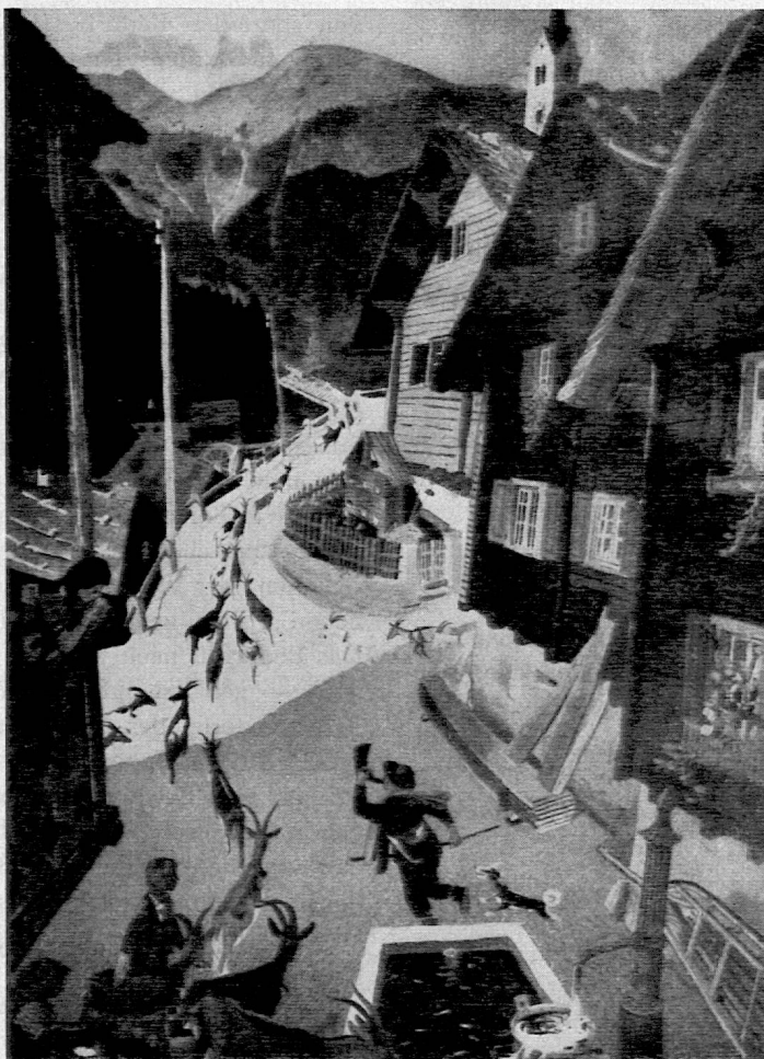
Schweiz. Schulwandbild: Auszug des Geisshirten

Das erwähnte Schlagwortverzeichnis ermöglicht Interessenten, sich auf raschem Wege Unterlagen zu aktuellen Schulproblemen beschaffen zu können. Im allgemeinen stehen die Zeitungsausschnitte den Benützern der Bibliothek zur Einsicht im Lesezimmer zur Verfügung, in besondern Fällen kann jedoch auch die Bewilligung zum Ausleihen erteilt werden. Dr. P. Frei, dem Betreuer des Archivs, sei an dieser Stelle für seine Arbeit bestens gedankt.